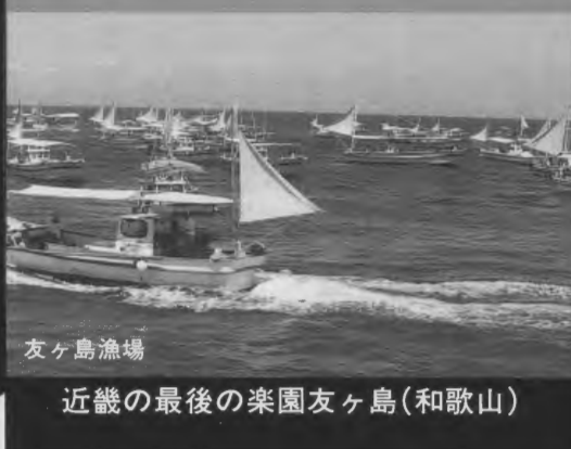
友ヶ島漁場 近畿の最後の楽園友ヶ島(和歌山)

本社：〒662 兵庫県西宮市池田町9番18号 ☎0798(26)3111 東京本社：〒150 渋谷区恵比寿4丁目3番3号 ☎03(3442)8411