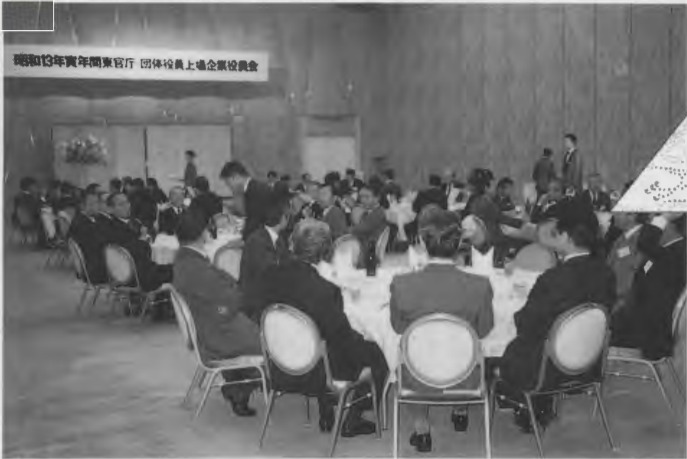
なごやかに発会…念願の関東寅年会がスタートした (新高輪プリンスホテル国際館「天平の間」)