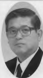
関谷 勝嗣(愛媛) 衆議院議員

これは、私は運が良い、自分にたいした力もないのに今日まで来られた事は、多くの皆様のお蔭と常日頃感謝していますが、私