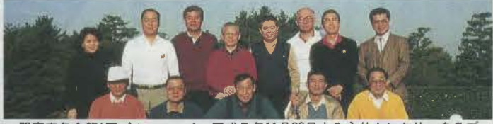
関東寅年会第1回ゴルフコンペ平成5年11月26日よみうりカントリークラブ

国会議員、省庁課長以上、都、道、府、県、市(市は衛星都市含まず)次長以上、上場企業役員、団体役員、大学は医学部教授。 ※この会は一度例会に出席されると、永久に資格を得ることになります。 入会金は頂いておりません。 この会を運営維持していくため、維持費として年間¥10,000を頂いております。ぜひご協力の程、よろしくお願い致します。