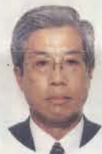
明治乳業株式会社 常務取締役東京支社長