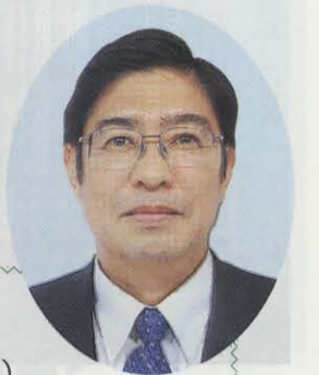
財団法人民間都市開発推進機構

平成元年10月、近畿で昭和13年寅年官庁団体役員上場企業役員会が産声をあげ、翌平成2年関東寅年会、平成4年東海寅年会と次々と誕生して参りました。