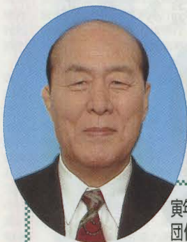
寅年S13・S25・S37・S49年官庁 団体役員・上場企業役員会 幹事 大阪経済倶楽部会長