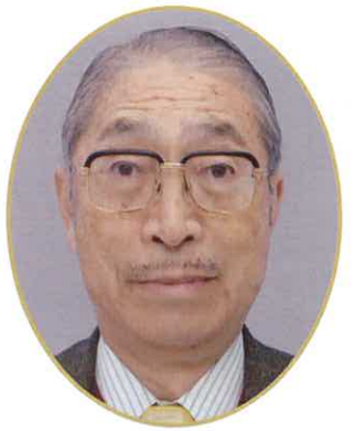
世界貿易センター相談役 (元海外経済協力基金理事)