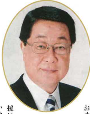
自由民主党経理局長 衆議院議員

が生き残るかご存知でしょうか。一見、強い種が生き残りそうですが、実はそうではないようです。強い弱いは関係なく、環境の変化にうまく適応・順応できた種のみが、淘汰されず生き残っているそうです。強い種が生き残るのであれば今頃は恐竜が地球を支配している状況になるはずですね。 恐竜は大きな環境の変化に適応・順応できず滅んだといわれています。 これからの日本経済を取り巻く環境も劇的な変化が立て続けに起きそうです。ですので、私たち企業もその変化に柔軟に対応し、順応し生き残れるよう努力しなければならぬのではないかと思います。 年頭にあたり、大阪経済倶楽部の皆様のご健勝とご活躍をお祈り申し上げます。 新年のご挨拶とさせていただきます。