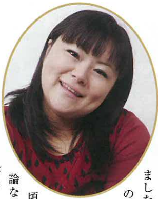
株式会社ゴッドワールドエンターテインメント 取締役副社長