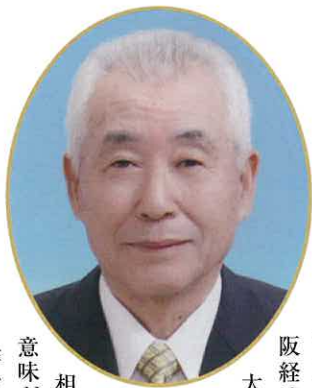
北海道青年団OB会長 元全国市長会副会長(元深川市長)