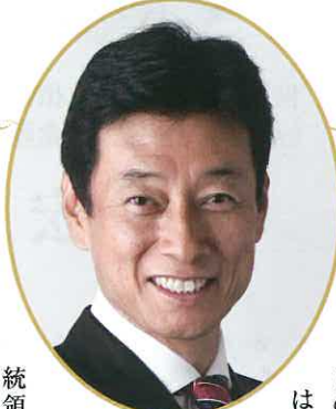
内閣官房副長官 衆議院議員