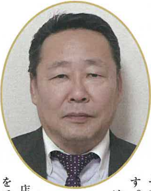
株式会社薬栄 取締役本部長